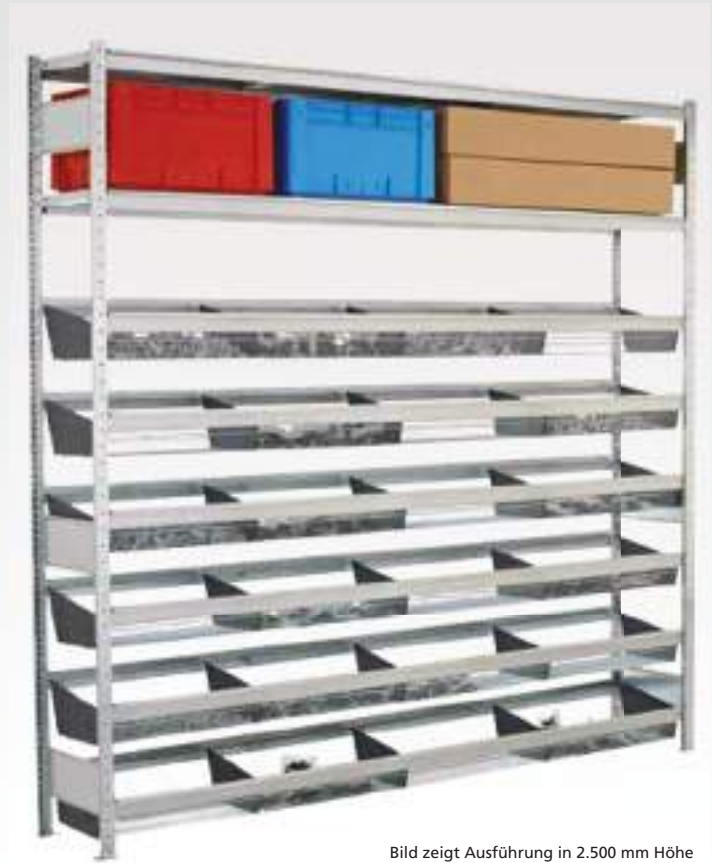
Bild zeigt Ausführung in 2.500 mm Höhe